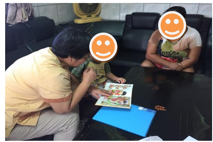
到宅服務-社工與專業老師至案家服務案主，認知學習及肢體動作練習