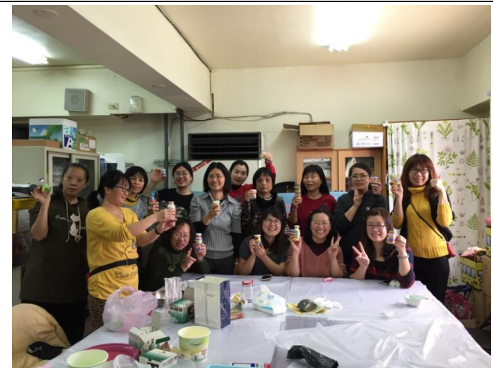
心毓天使家長聯誼會/透過本會辦理聖誕節關懷活動，家長們 帶著孩子們至老人養護中心陪伴長輩度過溫馨的聖誕節辦理