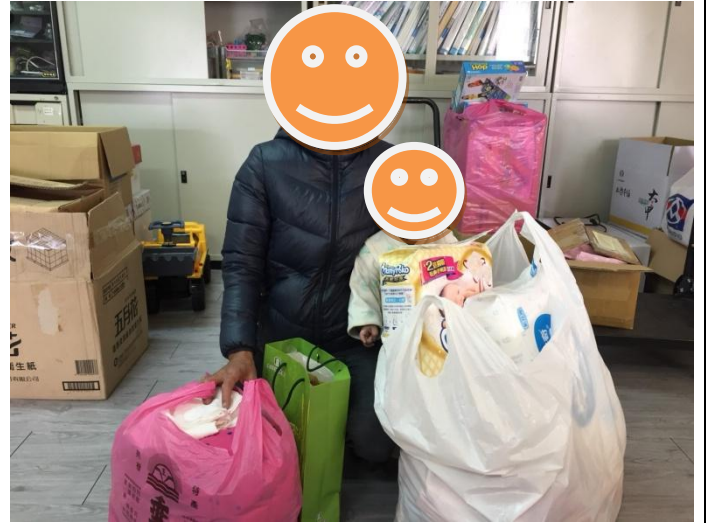
早療服務對象-寒冬送暖到案家(在12月送給服務案家溫暖棉被，讓冬天可以溫暖度過