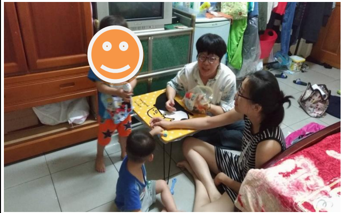
我的玩具醫生/陪輔員團督及個案研討、到宅陪輔人員至案家服務 於服務後和家庭主要照顧者討論孩子狀況