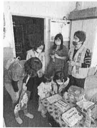
弱勢家庭關懷(學童教育費及急難救助補助)