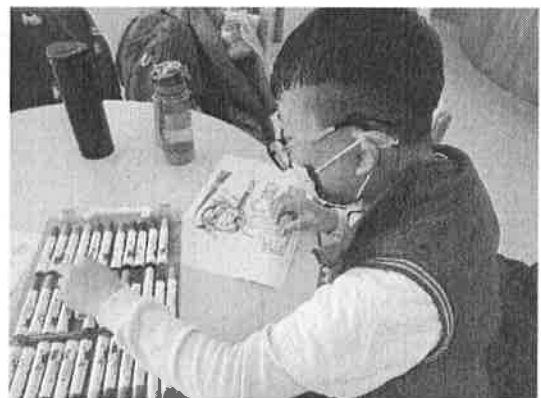
弱勢學童醫療補助(助聽器補助)