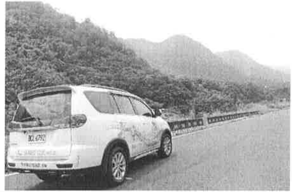
All-in-one 專車前進偏鄉服務