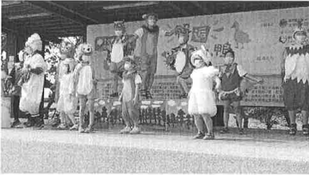
慢啼寶貝茄寶兒童劇團園夢計畫