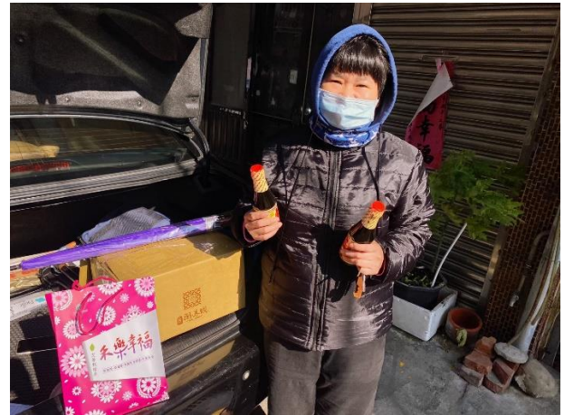
弱勢家庭關懷(年菜及急難救助補助)