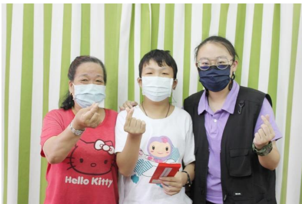
弱勢家庭關懷(學童教育費及急難救助補助)