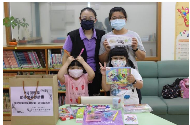
弱勢家庭關懷(學童學用品補助)