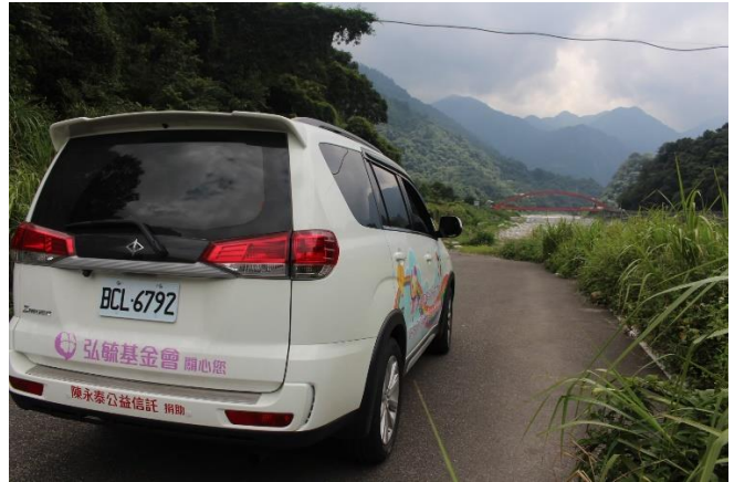
All in one 專車服務進入偏鄉服務