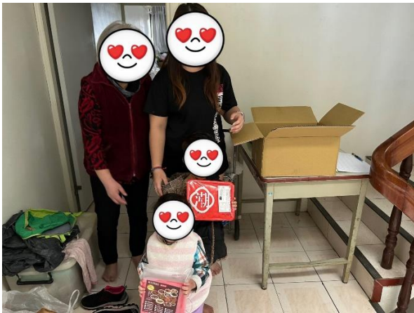
弱勢家庭關懷(年菜及急難救助補助)