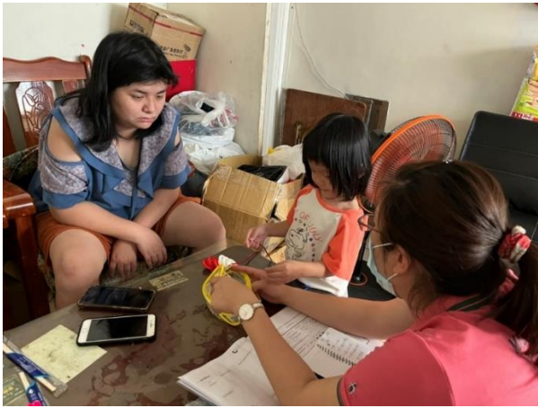
到宅服務-我的玩具醫生