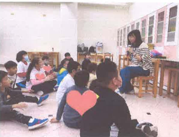
早療服務計畫-慢啼寶貝茄寶兒童劇團培訓