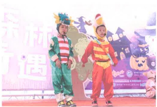
早療服務計畫-慢啼寶貝茄寶兒童劇團公演