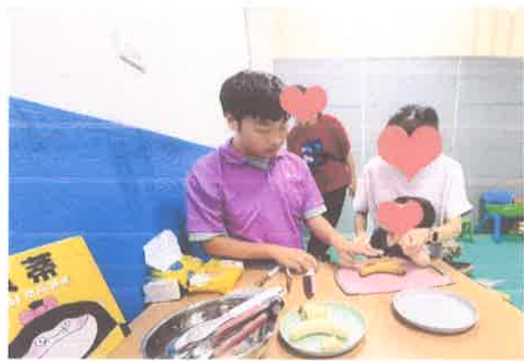
友善環境計畫-療育教學使用教玩具及設備