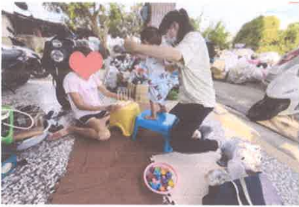
早療服務計畫-專業團隊到宅服務