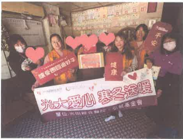
家庭支持計畫-弱勢家庭關懷(寒冬送暖)