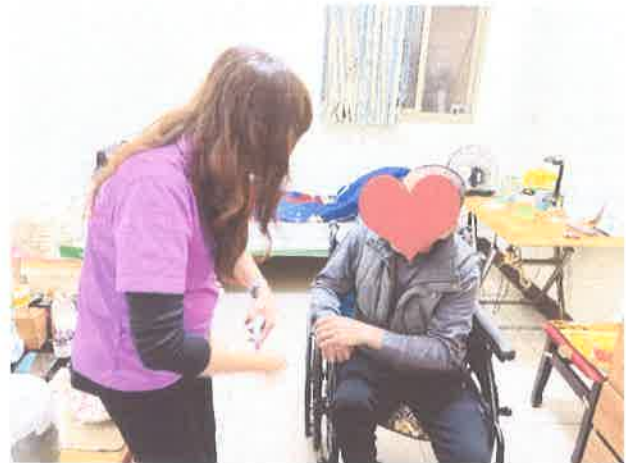
家庭支持計畫-弱勢家庭關懷(寒冬送暖)